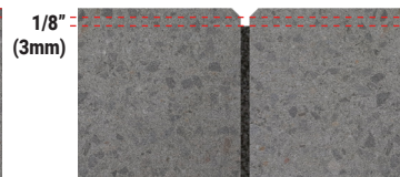
PAVÉS OU PIERRES NATURELLES AVEC CHANFREIN

EXIGENCES DU SABLE POLYMÉRIQUE Largeur minimale des joints: 3 mm (1/8") Largeur maximale des joints: 10 cm (4") Largeur maximale des joints avec base de recouvrement: 5 cm (2") Profondeur minimale des joints: 38 mm (1 1/2")