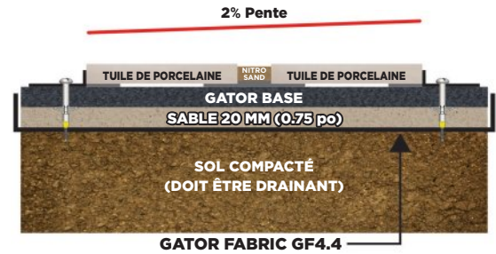
COUPE TYPE D'UNE INSTALLATION DU SYSTÈME GATOR TILE